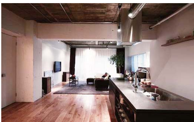
リノべる株式会社のリノベーション事例

現在の展開エリアは、仙台・東京・神奈川・埼玉・千葉・静岡・名古屋・京都・大阪・神戸・岡山・福岡の11エリア。