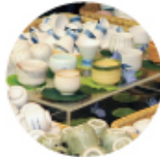
選べるMY猪口 (イメージ)