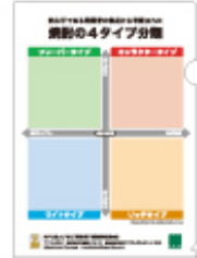
4タイプクリアファイル