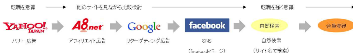
図 1: 転職支援サイトを利用するユーザの接触履歴の例

そのため、JAC では、広告以外での流入も含め、長期検討しながら様々な経路で接触するユーザとの接点を正しく把握したいという要望があった。そこで、「ウェブアンテナ」を導入することにより、図1のような自然検索やソーシャルメディアを含む全ての接触をコンバージョンから 180 日前に遡って計測し、ユーザの検討状況に合わせた接触ができていのかどうかを評価することが可能となった。さらにビービットが提供する分析用ツールにより、媒体接触の重複分析や、獲得までのリードタイムの分析など、複数の軸での分析を効率的に実施している。(図 2 参照)