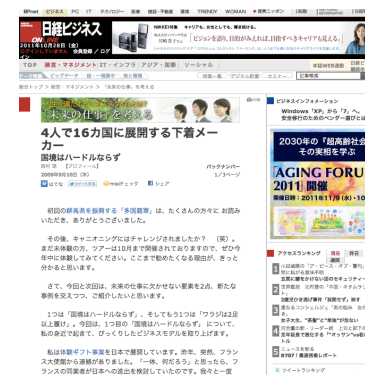
日経ビジネスオンライン 2009年9月