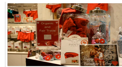
有楽町マルイ バレンタイン特設コーナーにて