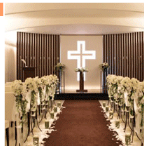
アン ウェディング ウィズ (AN WEDDING WITH)