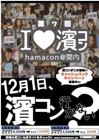
(イベント告知ポスター)

地域活性化イベント史上初！NFCを活用し地域別参加者動向が分析可能に！ (NFCとは)13. 56MHzの周波数を利用する国際標準規格で定められた通信距離10cm程度の近距離無線通信技術