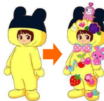
たまぐるみ全2種(まめっち、ラブりっち) ※写真はイメージです