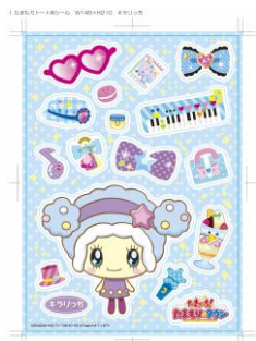
「でかたまもりしーる」