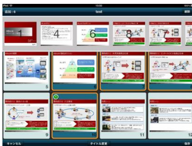
【ユーザープレイリスト機能】