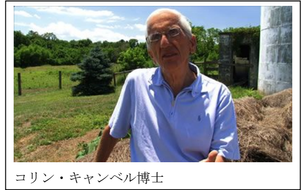
コリン・キャンベル博士

1940年代から、完全食品として推奨されてきた牛乳。 酪農業を営む家で少年時代を送っていたキャンベル博士も、 これを当然として疑わなかった。しかしあるとき、動物性タンパク質と ガンの関係に気付いた博士は、どの食物が何の病気の原因となるか を調べる大規模な調査に乗り出す。