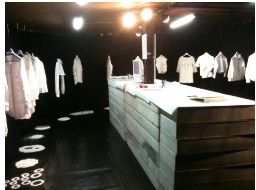
昨年度の白シャツ展示会

昨年度まで、『白』をテーマにバンタンデザイン研究所 大阪校が学内で実施してきたデザインシャツの展示会。今回は、バンタンの学生達の“デザイン”のチカラをより一層強く発信していく目的で、レコールバンタン 大阪校とのコラボレーションにより、校舎を飛び出して展示会を開催することとなりました。展示会場では、バンタンデザイン研究所の学生達による、『黒いデザインシャツ』と、レコールバンタンの学生達による『黒いマカロン』を発表。各日先着100名様には、レコールバンタンよりノベルティをプレゼントさせていただきます。大阪校での両校合同でのイベント開催は初めての試みのため、学生達にとつての期待もひとしおで、現在、当日に向けて作品企画を制作中です。当日は是非、会場に足をお運び頂き、バンタン大阪校の『黒』をご体感下さい。