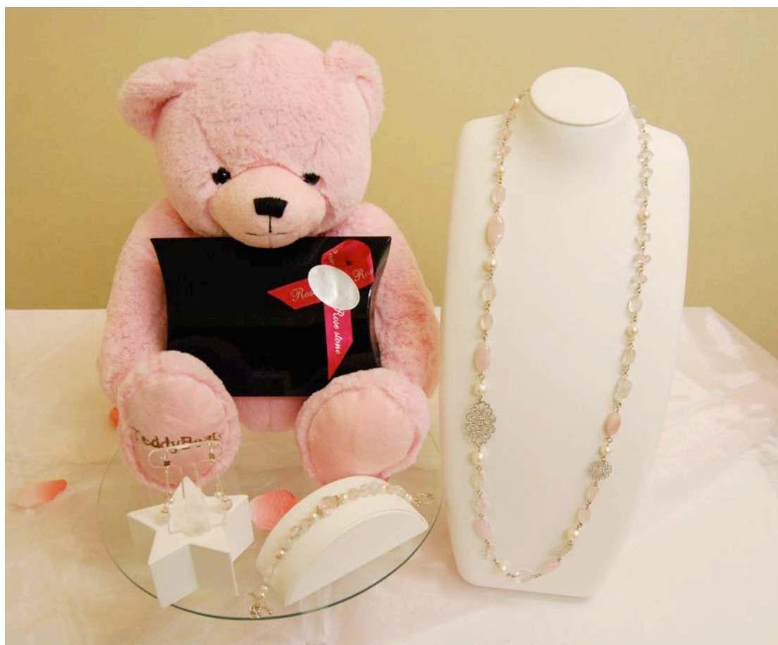
Rosemiwa 中身の見える福袋 セット例：