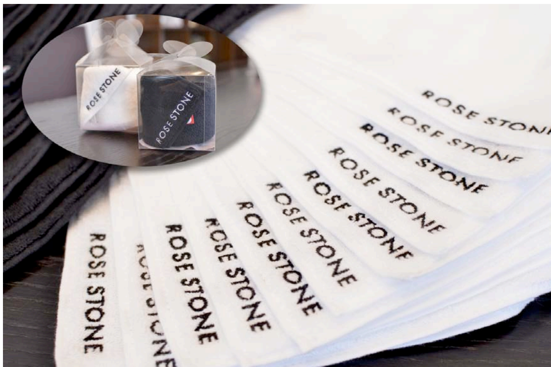
ROSE STONE ロゴ入り今治ハンドタオル。ブラック／ホワイトの2色からお選びいただけます。