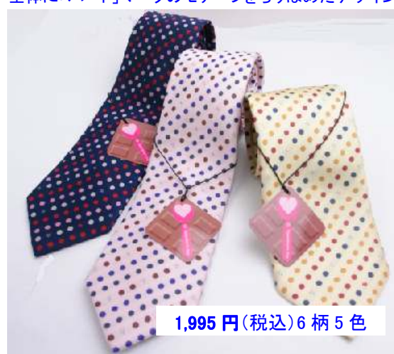
ネクタイの先端に 1 つだけ小さなハートマーク！