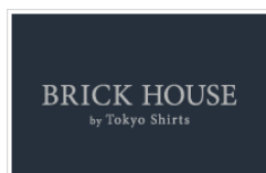
バレンタイン「限定リング」付。結び目のリングにハートのモチーフを！

主力シャツ業態の BRICK HOUSE(左) レディース業態の Queen Arrow(右)