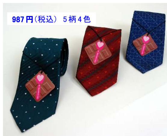
全体に「ハート」マークのモチーフをちりばめたデザイン。