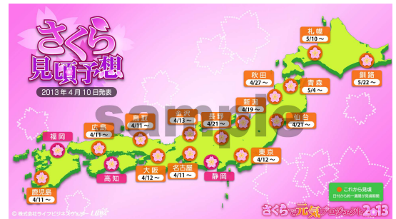
全国のさくらの見頃予想

Twitterは、アメリカ合衆国また他国々におけるTwitter, Inc.の登録商標です。