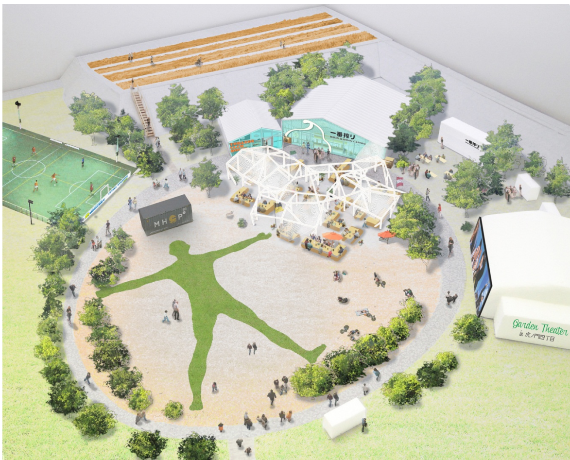
※MORI TRUST GARDEN TORA4 イメージ