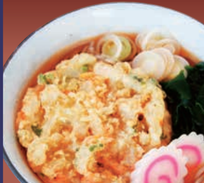
野菜かき揚げそば 580円