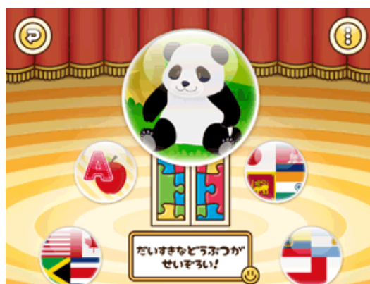
コンテンツ選択画面