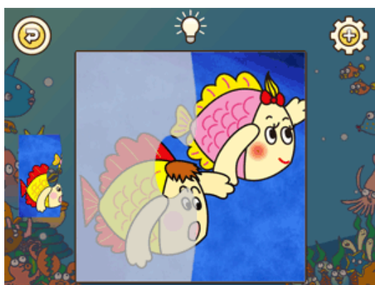
およげ！たいやきくん