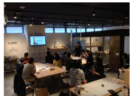
4 月 21 日に仙台市宮城野区で開催された『三陸人』ワークショップの様子

近年、国内観光のスタイルに変化がみられます。名所やグルメを堪能する旧来の「ハード消費型」の観光から、旅先で体験したり学んだりすることを楽しむ「ソフト体験型」の観光に関心が集まりつつあります。「COMMUNITY TRAVEL GUIDE」シリーズは、地域に暮らす生き生きとした人こそが「ソフト体験型」観光を支える原動力だと考え、地域の人との出会いを楽しむ旅を提案しています。