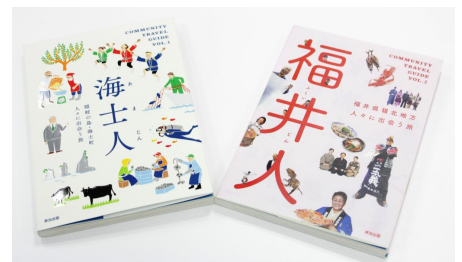
「COMMUNITY TRAVEL GUIDE」第 1 弾『海士人』と第 2 弾『福井人』(2013 年 4 月 16 日発売)