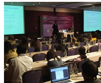
国際アンチエイジングシンポジウムの様子

2011 年 9 月にはタイ・バンコクで行われた「第 3 回・国際アンチエイジングシンポジウム（国際アンチ・エイジングと再生医療医学会）」にチェアマン（座長）として出席、学術発表を行ったほか、同年 11 月にはイギリス・ロンドン（Skin Geeks 社主催）で、“幹細胞およびグロースファクター（細胞成長因子）の化粧品への応用、その未来”と題したセミナーを開催、また日本へも定期的に訪れ、セミナーを開催するなど、世界各国でグロースファクター治療の普及を促す活動を精力的に行っている。