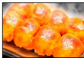
東日本餃子王 丸満 「丸満餃子」