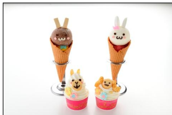
ジェラートの名店「ダ ルチアーノ」では デコジェラートが登場