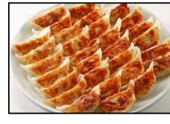
博多一口餃子発祥 【薬院 宝雲亭】 「宝雲亭一口餃子」