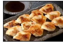
芦屋の一口餃子 【壱心】 「一口餃子 壱心」