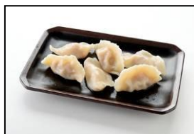
長崎新地中華街の名店 【老李】 「老李の長崎水餃子」