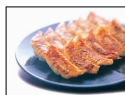
宇都宮市最多店舗数 【宇都宮餃子館】 「宇都宮 健太餃子」