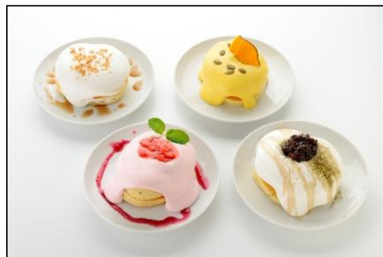
「レンガえんとつ」ではトッピングでデコレーションされた 新感覚のデコパンケーキが登場