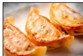
人気餃子王 包王 「牛とん包」