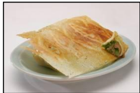
羽根付き餃子発祥【ニイハオ】 「元祖羽根付き餃子」