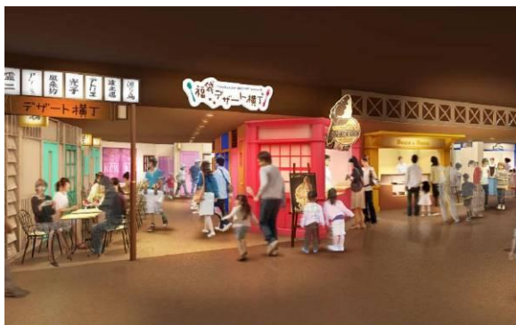
福袋デザート横丁イメージ

「福袋七丁目商店街」には、デコレーションされたデザート“デコデザート”を通年提供する「福袋デザート横丁」が新登場します。“デコデザート”づくりに定評のある職人が織り成す、動物などをモチーフにしたケーキやアイス等で、思わず誰かに伝えたくなるおいしさと驚きを体験できます。 プリン&チーズケーキのお店「Deco&Deco」は東京初出店となります。