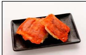
新感覚餃子【安亭】 「元祖チーズ羽根付き餃子」