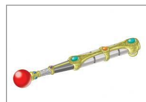
参加者が手にする魔法の杖 イメージ

仲間と一緒に空とぶ教室に乗り、最 さいききょう 恐のドラゴン「ワルーガ」が待つ森へ出発だ！