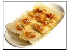
東京ひとくち餃子の名店 【赤坂ちびすけ】 「ちびすけ餃子」