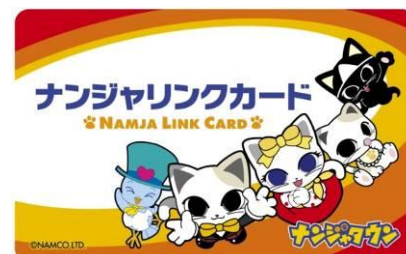
ナンジャリンクカードイメージ

「爆裂！蚊取り大作戦」・「ガウストパニック」 「幸せの青い鳥」・「若返りの秘宝」