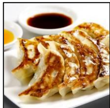
横浜中華街の老舗 【四五六菜館】 「四五六菜館餃子」