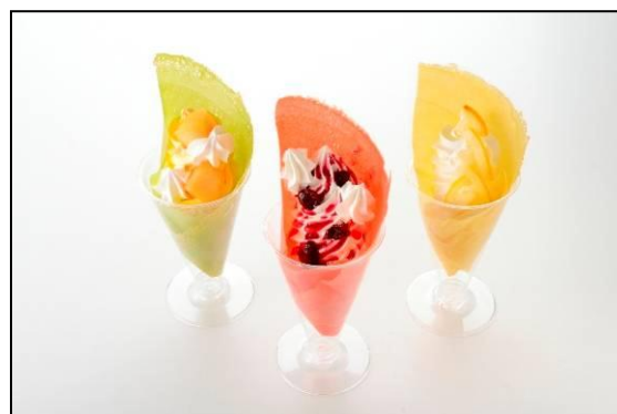
「サンタチューボー!」の パリパリ感が楽しいデコクレープ