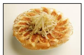
浜松餃子の草分け的存在 【石松】 「石松餃子」