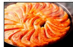
西日本餃子王 鉄なべ荒江本店 「鉄なべ餃子」