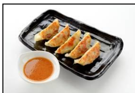
神戸南京町の名店 【皇蘭】 「神戸味噌だれ餃子」