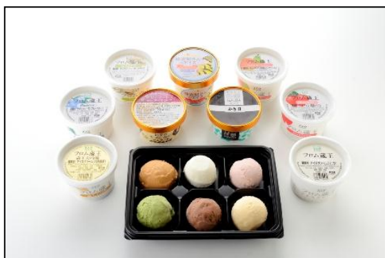
「ご当地アイスパーラー」では ご当地アイスの盛り合わせで食べ比べ