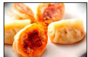
話題餃子王 華興 「華興餃子」