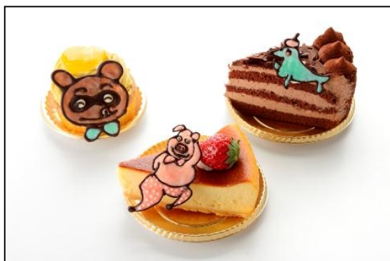
「Patisserie Cute」では かわいいデコケーキが登場