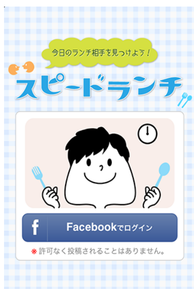
『スピードランチ』Facebook ログイン画面

『スピードランチ』の特徴は、ランチカードを媒介に 2 人のユーザーが異なる役割を果たす点にあります。一方がその日のランチ提案カードを作成することで、他方はそのカードを引くことができるようになります。当日のランチ時間を同じ場所で過ごしたい人が共有するため、よりスムーズで気軽なマッチングを成立させます。