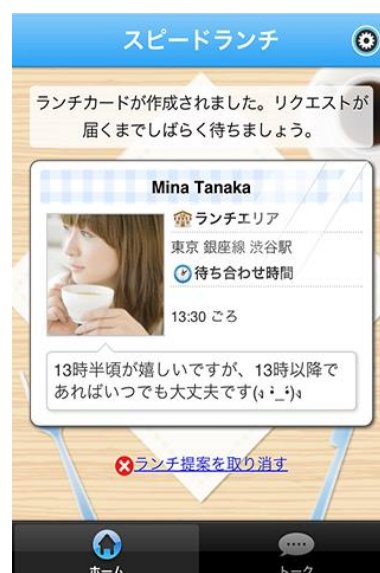
作成完了後はランチカード画面が表示