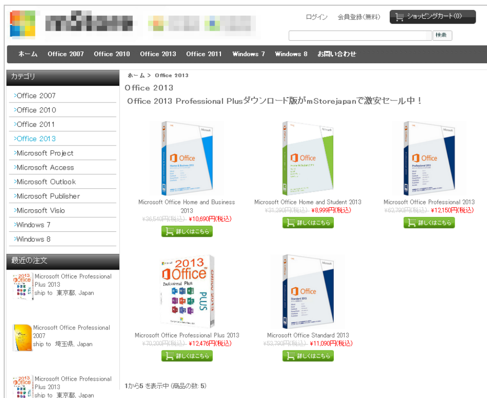
マイクロソフトの正規代理店をかたる詐欺サイト（一部加工しています）

5 月度に Windows®で、マイクロソフト製品を販売している詐欺サイトを検知しました。マイクロソフトの正規代理店であるとかたり、送料無料や 70%以上のディスカウント金額を掲載して、購入後に送られてくるプロダクトキーが偽物であったり、入力したクレジットカード情報が不正利用されたりするなどの報告が寄せられています。また、このサイトは個人情報の送信が暗号化されておらず、特定商取引法による企業情報の記載もありません。ウェブサイトのデザインはきれいに作られているため、オンラインショッピングにあまり慣れていない人にとっては、だまされやすいサイトとなっています。