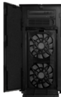
フロント(フィルター開)