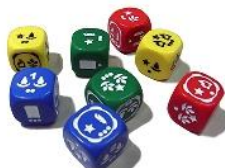
▲季節によって異なるダイス