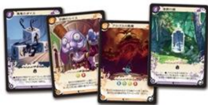
▲さまざまな魔法を駆使