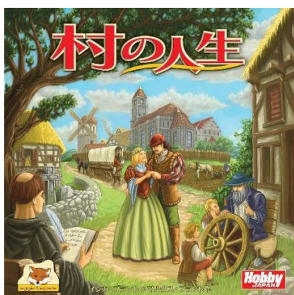
▲『村の人生』日本語版パッケージ

このゲームでは、プレイヤーは村に住む一族となり、様々な手段で名声を得ようとします。ただし、忘れてはならないのが時間は過ぎていくということ。そして、人は永久には生きていられないということ。しかし、たとえ死んだとしても、その行いが素晴らしいものであれば一族の村での名声は永久に残ることになります。たとえ自分が死んだとしても、あとを継ぐものがあるならば、引き続き一族の栄光を積み上げてくれるでしょう。