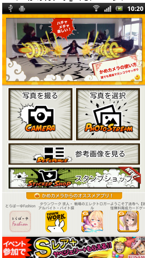
<『かめカメラ』TOPページ>