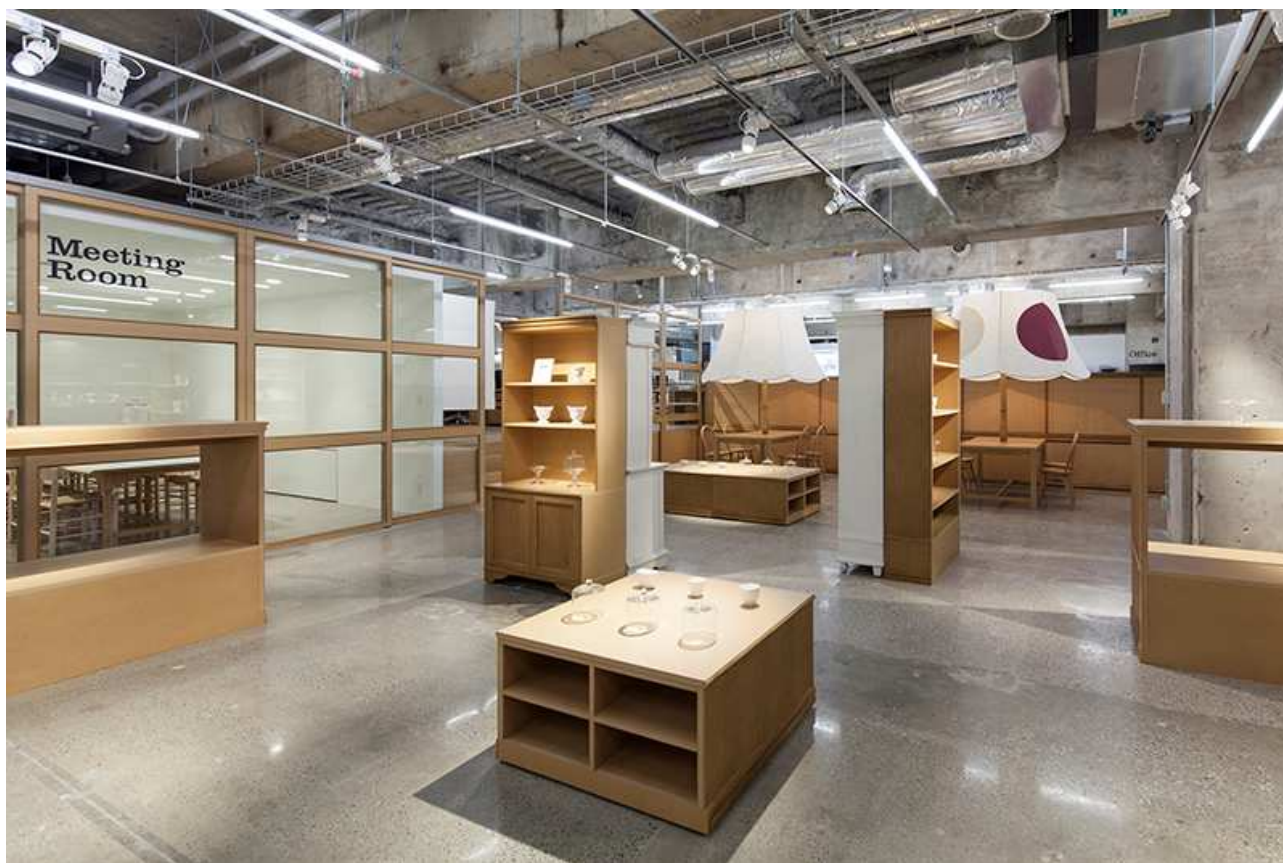
アミファッションルーム紹介 (2013年7月5日撮影の竣工写真です)