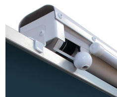
特許申請中の巻取り機構部とプルコード