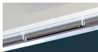
黒板と水平に張れ、邪魔にならない紐式ハンドル