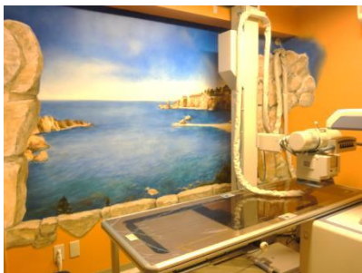
トリックアートを描いたレントゲン室 閉鎖的で怖いイメージが強いX線室には、イタリアのタオルミーナの絵画で、開放的で楽しい空間にしました。

第一次世界大戦の負傷兵のリハビリのために設計されたエクササイズ。主にインナーマッスルを鍛え、故障しにくいカラダをつくります。有酸素運動と無酸素運動、ストレッチに呼吸法が組み合わせられたエクササイズのため、基礎代謝も高まるため女性からも人気。夏バテ対策にも最適です。