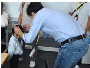
社長からもらった子ども社員証

当社では、今後もこのような活動を通じて、幅広い世代の方々にWebの楽しさを知ってもらうとともに、様々な教育・経験の機会を提供していきたいと考えています。