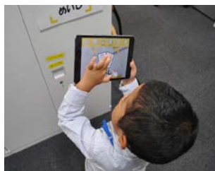
iPadをかざしてタッチ