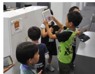
フロアの中でAR マーカー探し