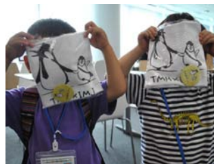
お土産のロゴ入りタオルと缶バッジ