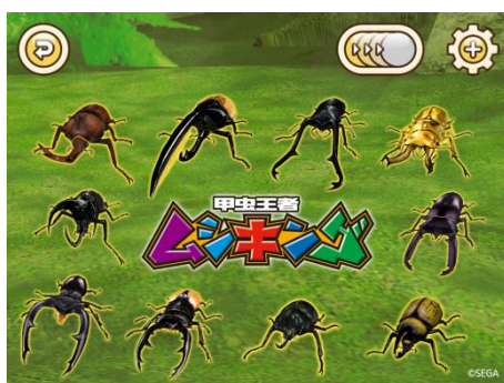
甲虫王者ムシキング パズル選択画面