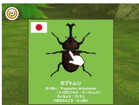
甲虫王者ムシキング 甲虫解説画面