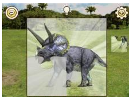
古代王者 恐竜キング プレイ画面