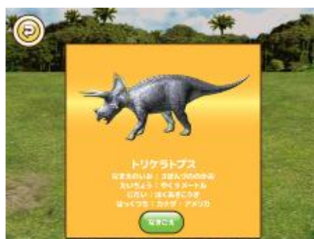
古代王者 恐竜キング 恐竜解説画面