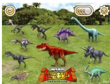
古代王者 恐竜キング パズル選択画面