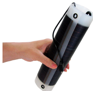
手で巻いて簡単に持てる柔らかい 100g ソーラーシート