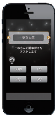
①初期画面。ここで調べたい相手の名前を入力する。または既に登録している5名のなかから選択する。