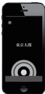
③テストする相手の名前が一瞬表示される。被験者は名前が確認できたらボタンを押す。表示時間は1/30秒程度。