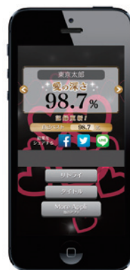
④テスト結果表示画面。0~100%の範囲で表示される。