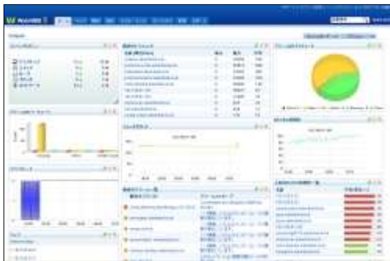
(図 1) Web クライアントの旧ダッシュボード画面