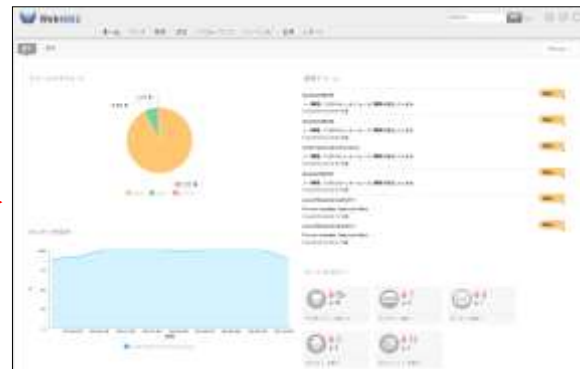
(図 2) Web クライアントの新ダッシュボード画面