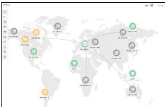
(図 3) Web クライアントのマップ画面