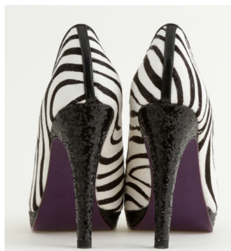
紫（働く COOL PURPLE）