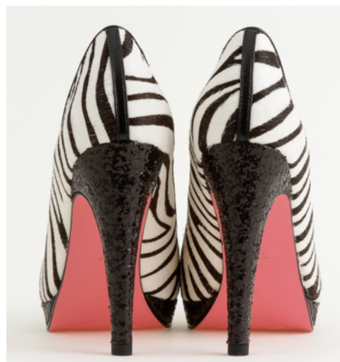
ピンク（恋する BABY PINK）