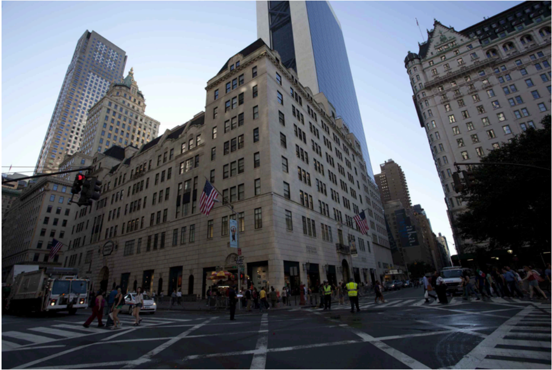
『ニューヨーク・バグドルフ 魔法のデパート』

これからも、『Shoes of Prey』は様々な取り組みを通して、より多くの方々に、オーダーメイドシューズをデザインする楽しさをお伝えしていければと思っております。