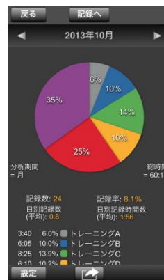
トレーニング種別