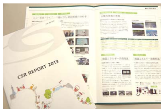
具体的な数値や事例を多く盛り込んだ今年のCSR報告書。

当グループはこの勉強会を計8日間で11回開催。合計130名超の受講者数を予定しております。SBSグループでは、一人ひとりのCSRに対する意識の向上を小さな実践を通じて、社会の期待により一層お応えできる企業グループの構築に努めてまいります。