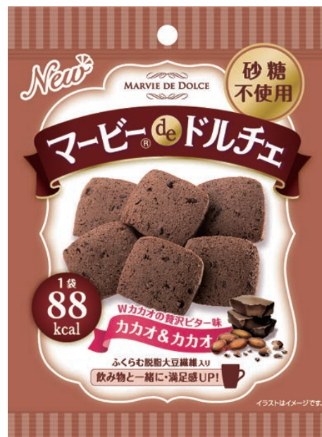
マービーdeドルチェ(カカオ&カカオ)