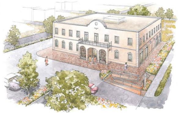
市内初の出産専門施設『ファミリー産院 君津』 2014年2月4日開院 (千葉県君津市郡)

内装のコンセプトは病院らしくない楽しさと、女性がわくわくするようなトキメキを盛り込みました。2階に14室ある入院室には、パリ・コペンハーゲン・バリ・京都・モナコといった各都市をモチーフとしたデザインを盛り込み、出産という大仕事を終えたお母さんがホッと出来る環境をめざしました。