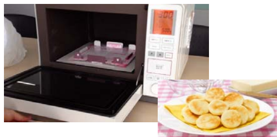
出来上がりイメージ