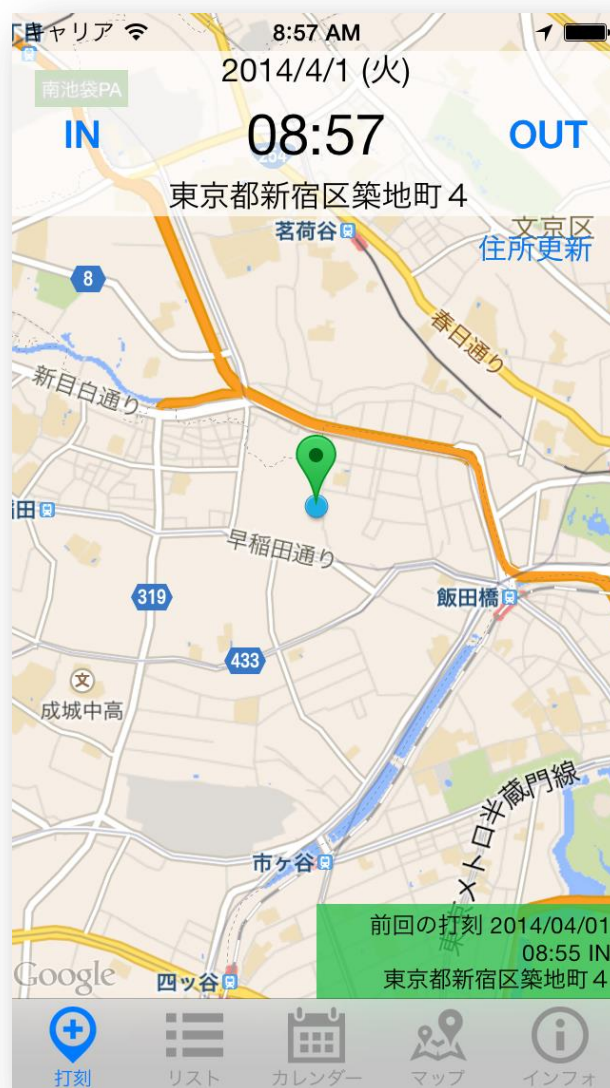
図 1. GPS タイムレコーダーにおける打刻画面

記録された情報は、リアルタイムでクラウド上にある「バイバイ タイムカード」の管理サーバへ送られます。