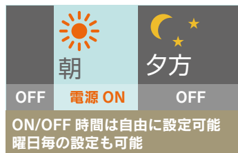
電源制御タイマー