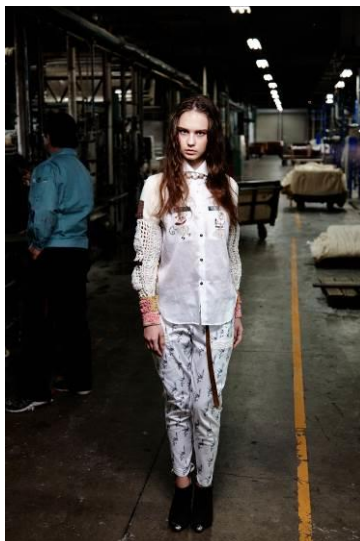
sagan x imeri(サガン×イメリ)コレクション