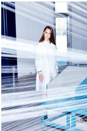
mifa(ミーファ)コレクション

大阪府大阪市中央区 西心斎橋 2-8-5 Tel:0120-757-333 HP: http://www.vantan.com/