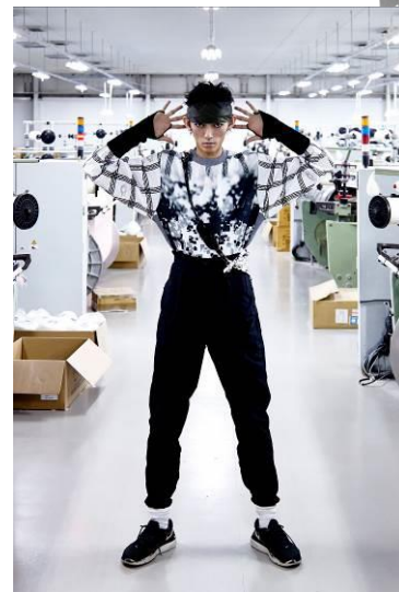
eisunoge(エイスノージ) コレクション