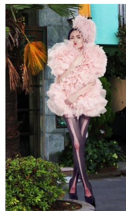
ースタイリングイメージー

今回のプロジェクトは、オリジナルスタイリングによる“デザインのチカラ”でこれまでにない新しい価値を生み出し産業の発展にも貢献したいと考えるバンタンデザイン研究所が、ショーテーマである『Sweets Heart』の実現に向け市場リサーチを開始、その中で、1962年の販売開始以来、50年以上にわたり販売を続けている LOOK チョコレートのバリエーションの豊富さに着目し、『Sweets Heart』を LOOK チョコレートとのコラボレーションで表現したいと考え企画を立案、株式会社不二家への提案の結果、企画に賛同いただいたことでスタイリングショーの実現に至りました。