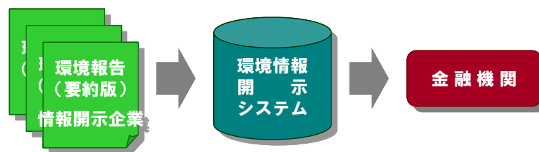
勘定情報開示システムの実証実験イメージ 環境省 2013 年 11 月 11 日リリースより(弊社デザイン)

実証実験は、昨年 12 月に募集が行われ、企業 64 社と金融機関等 13 社が参加、1 月に企業による環境情報登録※を実施。2 月から 3 月まで金融機関による試用により環境情報の有用性やシステムの利便性などを検証し、その結果について報告会等を実施するものです。