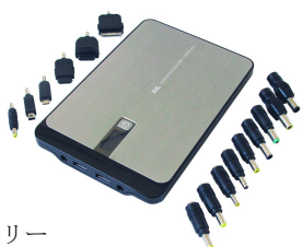
多彩なプラグを持つバッテリー