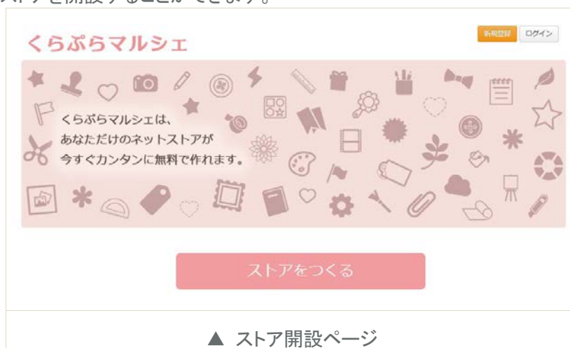
▲ ストア開設ページ

『くらぷらマルシェ』では、ウェブページの制作に関する知識のない方でも、作品の情報や画像、ショップ情報を登録するだけですぐにオリジナルストアを開設することができます。