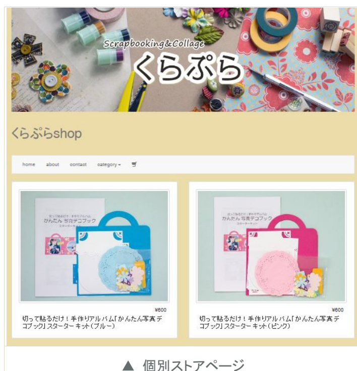
▲ 個別ストアページ