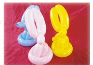
バルーンイメージ(うさぎ)

※ニュースリリースの情報は発表日現在のものです。発表後予告なしに内容が変更されることがあります。 ※価格は全て税込みです。 ※画像はイメージです。 ※商品は数量限定のため、品切れする場合がございます。