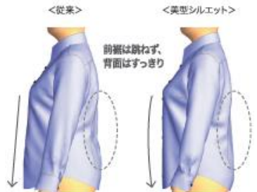
図：17号サイズの着用比較(シャツ)

標準サイズの美しさはもちろんのこと、単に大きいだけでない“すっきり”見える大きいサイズ、単に小さいだけでない“女性らしい”小さいサイズを可能にしました。