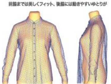
図：美型シルエット・シャツのゆとり配分

年齢を重ねると、サイズ(号数)は変わらなくても身体のリフォーム / 肉の付き方が変化します。美型シルエットは熟練のパタンナーによるパターン作成はもちろん、コンピュータ上で繰り返し試着を行える「グッドフィット・テクノロジー」を採用。客観的なデータを基に最適なゆとりの配分を導き出し、快適な着心地とともに、実際のボディラインよりも美しい、若々しさを感じさせるシルエットを実現しました。