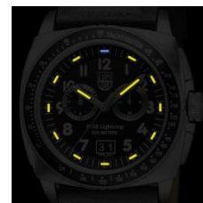
P-38 LIGHTNING CHRONOGRAPH 9440 SERIES