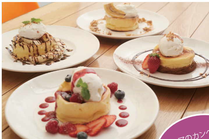
フレンチパンケーキ ¥880～

フレッシュな野菜とフルーツで作ったシャーベット状の冷たいドリンク。ビタミンやミネラル、食物繊維など豊富で、美肌・ダイエット・デトックスなど意識の高い女性に人気です。